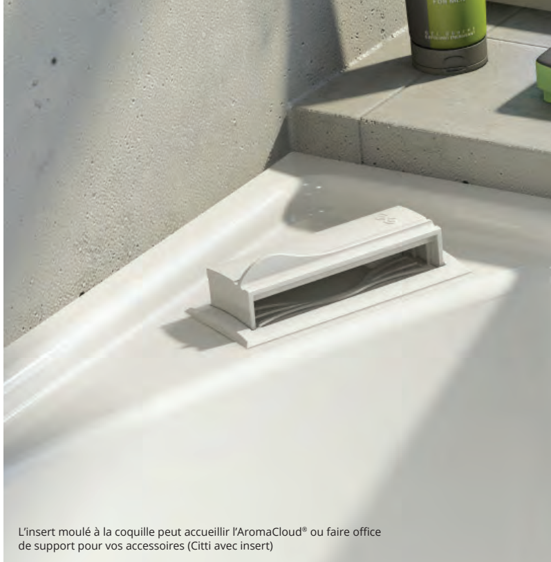
L'insert moulé à la coquille peut accueillir l'AromaCloud® ou faire office de support pour vos accessoires (Citti avec insert)