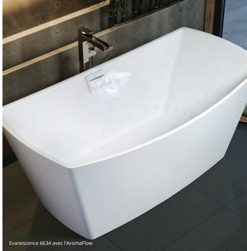
Evanescence 6634 avec l'AromaFlow