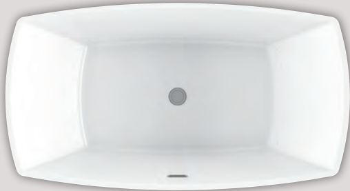
EVANESCENCE 6634 (AUTOPORTANT)