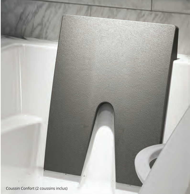
Cousin Confort (2 coussins inclus)