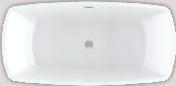
LIBRA 6632 (AUTOPORTANT)