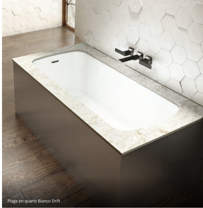
Plage en quartz Bianco Drift