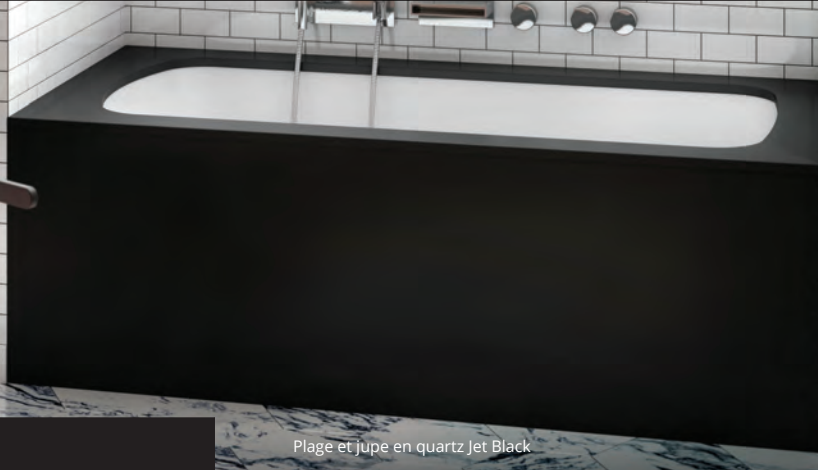
Plage et jupe en quartz Jet Black