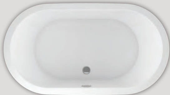
NOKORI OVAL 6737 (AUTOPORTANT)