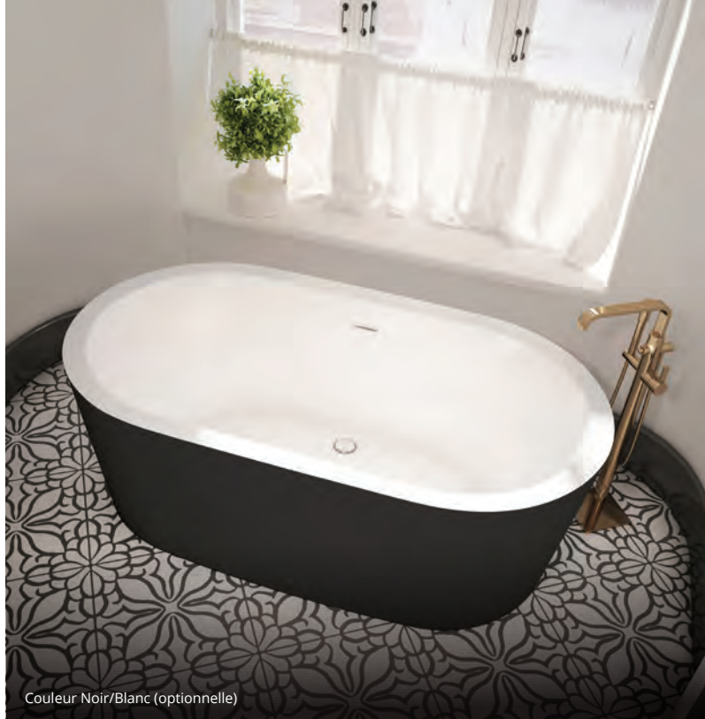
Couleur Noir/Blanc (optionnelle)