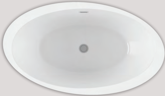
OPALIA 6839 ELLIPSE OBLIQUE - GAUCHE (AUTOPORTANT)