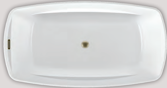
OPUS 6434 (AUTOPORTANT)