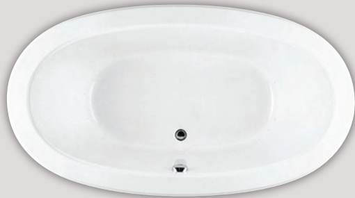
NAOS 7240 (AUTOPORTANT)