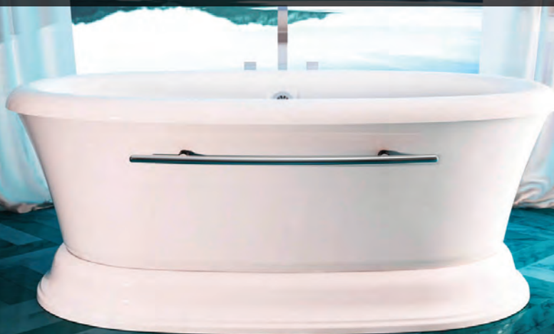
Avec rebord arrondi

Balnéo se définit simplement par l'art de prendre un bain. Pour BainUltra, l'importance de prendre un bain s'inscrit dans l'art de vivre qui consiste à ralentir et à prendre du temps pour soi.