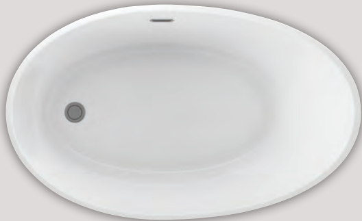
EVANESCENCE 5936 (AUTOPORTANT)