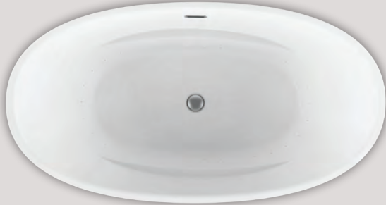
LIBRA OVAL 6635 (AUTOPORTANT)