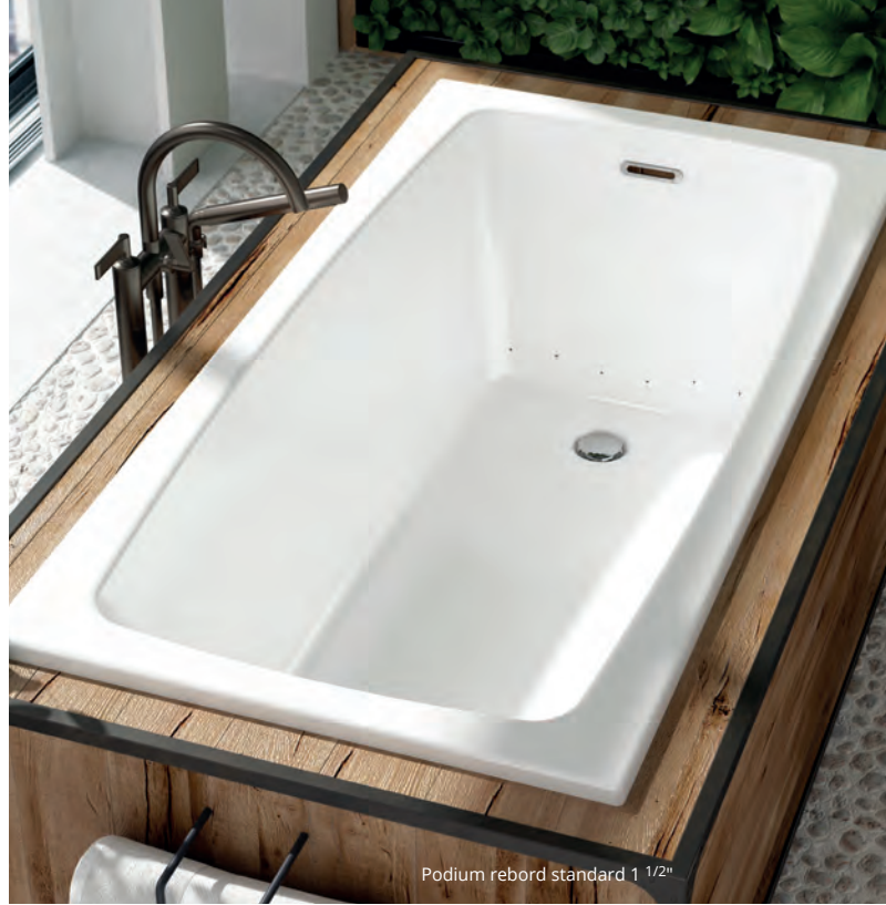
Podium rebord standard 1 1/2"