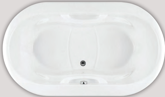
AMMA OVAL 7242