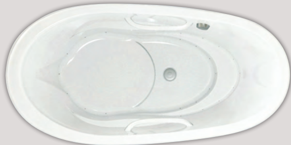
ESSENCIA OVAL 7236 (AUTOPORTANT)