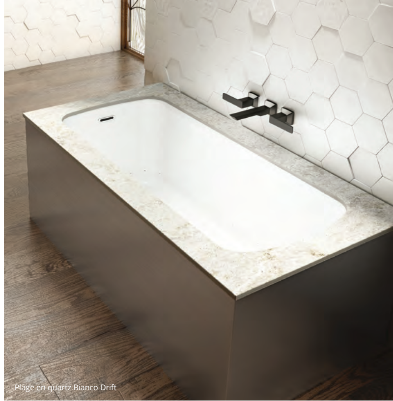
Plage en quartz Bianco Drift