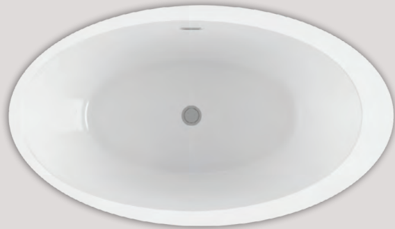
OPALIA 6839 ELLIPSE DÉCENTRÉE - GAUCHE (AUTOPORTANT)