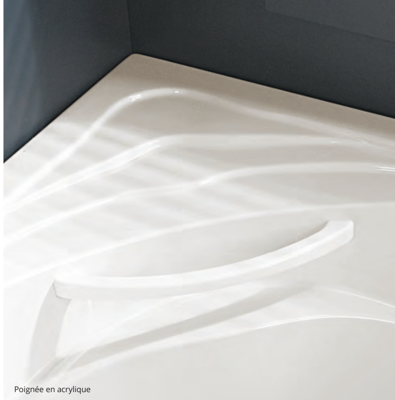
Poignée en acrylique