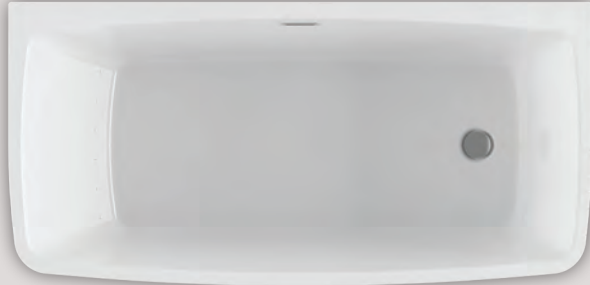
VIBE MURAL 5828 (AUTOPORTANT)