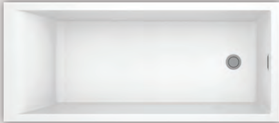
NOKORI 6429 (AUTOPORTANT)