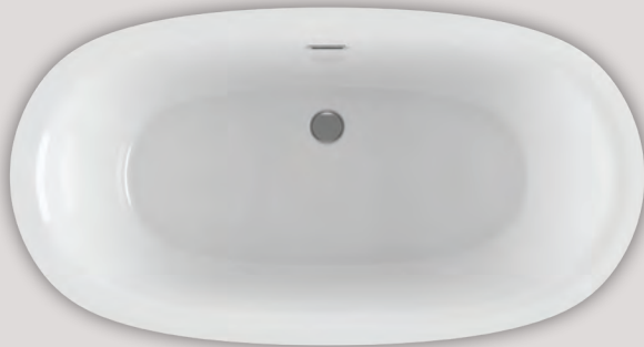
VIBE DESIGN 6033 (AUTOPORTANT)